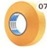
07 Masking Tape