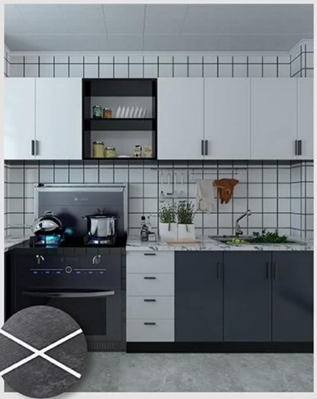
Cung cấp giải pháp toàn bộ phòng