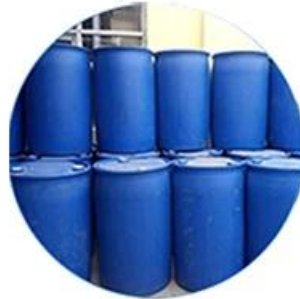
Real Material Stock