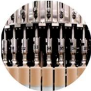
Filling Machine Line