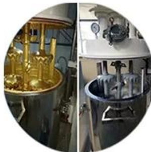
Batching Production Line