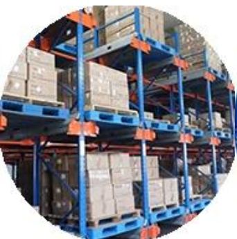
Vật liệu thực vật