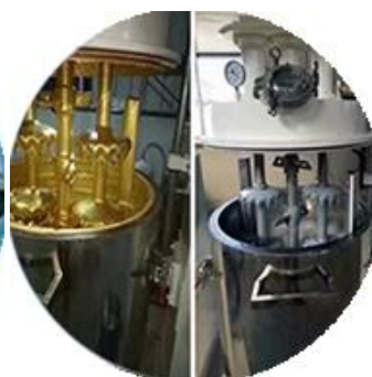
Dây chuyền sản xuất hàng loạt