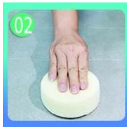
02 Ba Lan với sáp gạch trừ gạch tráng men.