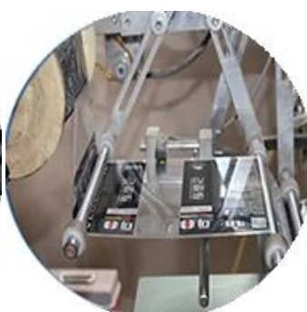
Máy bọc màng