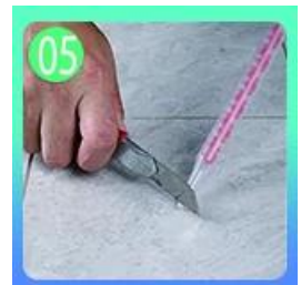
05 Nghiêng nghiêng trên cùng của vòi trong 45 °.