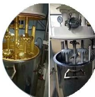
Dây chuyền sản xuất hàng loạt