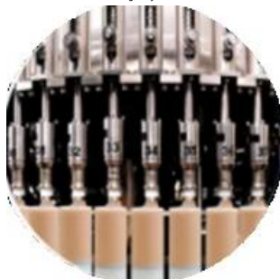
Dòng máy làm dây