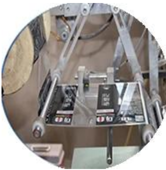
Máy bọc màng