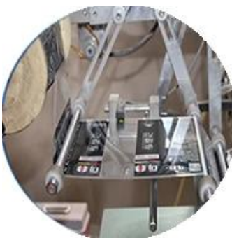
Máy bọc màng