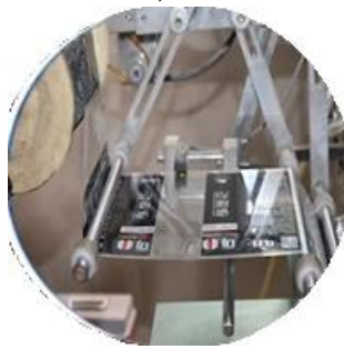
Máy bọc màng