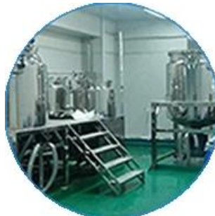
Máy kiểm tra