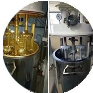
Dây chuyền sản xuất theo lô