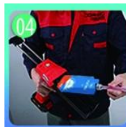
04 Vít trên vòi, đặt lên súng vừa.