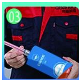
03 Mở & xem, cả hai bên có thể ép đều trong khi đó.