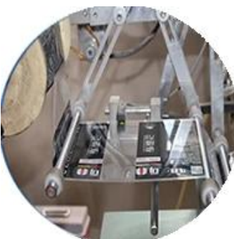
Máy bọc màng