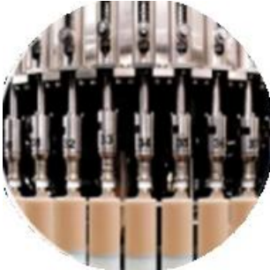
Dòng máy làm dây