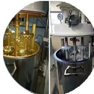
Dây chuyền sản xuất hàng loạt