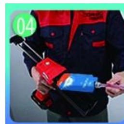
04 Vít trên vòi, đặt lên súng vừa.