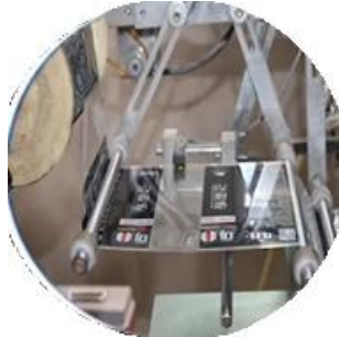
Máy tráng phim