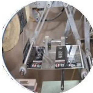
Máy bọc màng