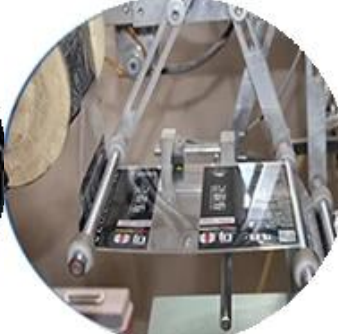
Máy bọc màng