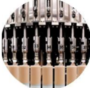
Dòng máy làm dây