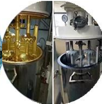
Dây chuyền sản xuất hàng loạt