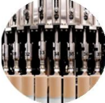
Dòng máy làm dây