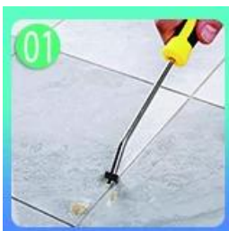
01 Làm sạch gạch và giữ khô.