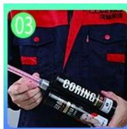
03 Mở & xem, cả hai bên có thể ép đùn trong khi đó.