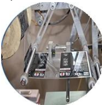
Máy bọc màng