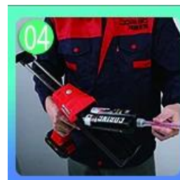
04 Vít trên vòi, đặt lên súng vừa.