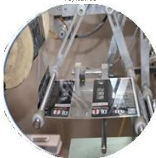
Máy tráng phim