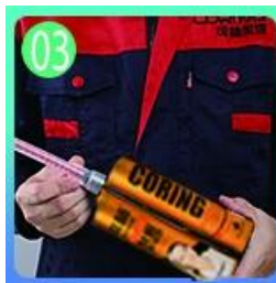
03 Mở & xem, cả hai bên có thể ép đùn trong khi đó.