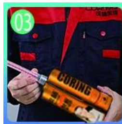
03 Mở & xem, cả hai bên có thể ép đùn trong khi đó.