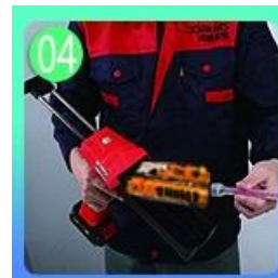
04 Vít trên vòi, đặt lên súng vừa.