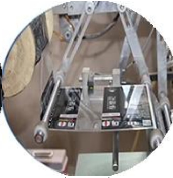
Máy bọc màng