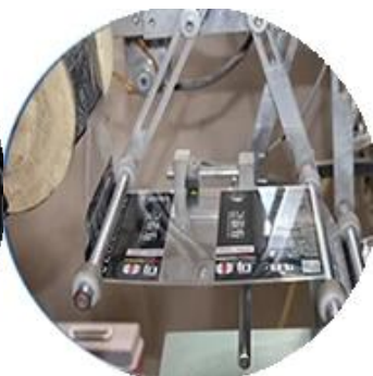
Máy bọc màng