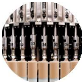
Dòng máy làm dây