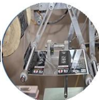
Máy bọc màng